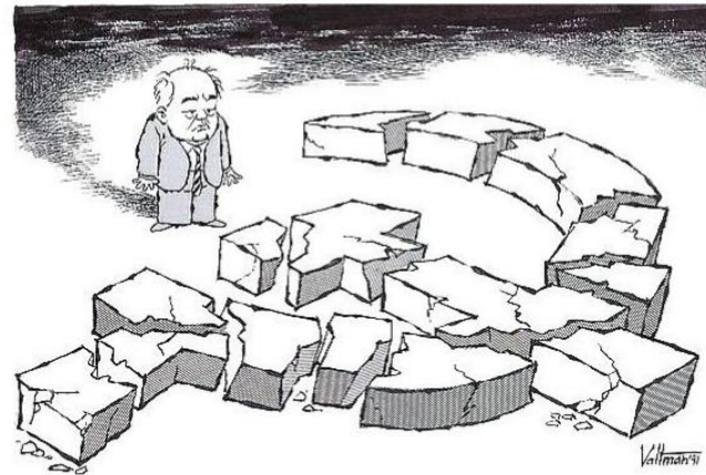
Edmund Valtman, 1991