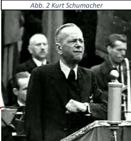
Abb. 2 Kurt Schumacher