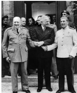
(Von links nach rechts: Winston Churchill, Harry S. Truman, Joseph Stalin)