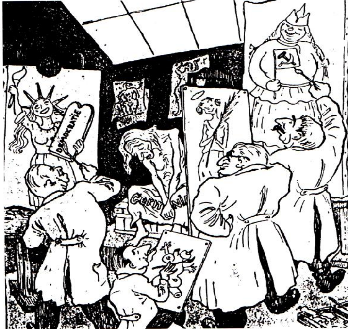
Die Außenminister Marshall, Bidault und Bevin sowie Stalin entwerfen ihr Bild vom zukünftigen Deutschland. Der Spiegel, 2.8.1947.